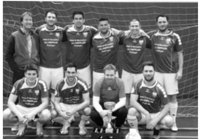
Turniersieger VFL Pfullingen

Der TSV Genkingen bedankt sich bei allen Mannschaften! Ein sehr großer Dank geht an unsere Sponsoren und Lieferanten, ohne die ein solcher Abend nicht stattfinden könnte.